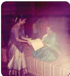
Receiving Prize from the legend- ary Musician 'Padmabhushan' Dr.M.L.Vasanthakumari