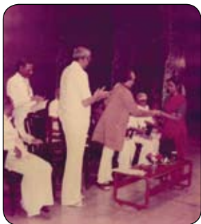
Prize from Sitar Maestro Pandit Sri Ravi Shankar Ji