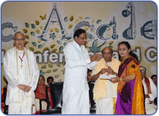
Receiving Best concert Award from Minister P.Chidambaram from music Academy, Chennai