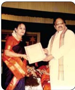
Receiving 'Yuvakala Bharathi' Award from the renowned playback Singer Sri S.P.Balasubramaniam