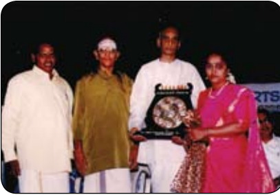
'MLV Award' from Padmabhushan Umayalpuram Sri Sivaraman